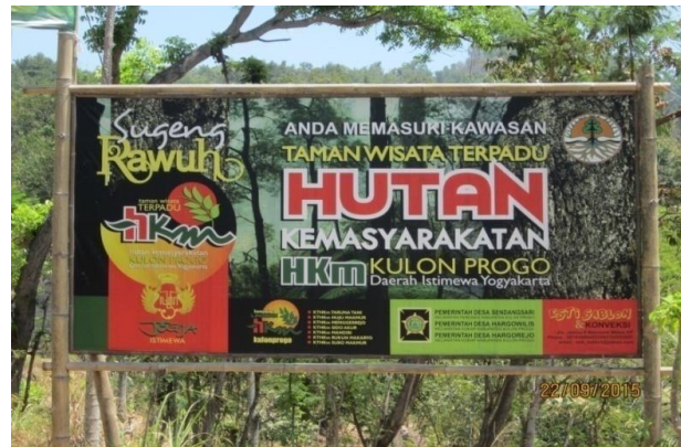
Gambar 2. Spanduk selamat datang di dusun Girinyono, di jalan masuk menuju Watu Gembel, Puncak Dipowono dan Kalibiru.

Bantuan dari pemerintah bukan hanya sebatas dana untuk pembangunan sarana dan prasarana