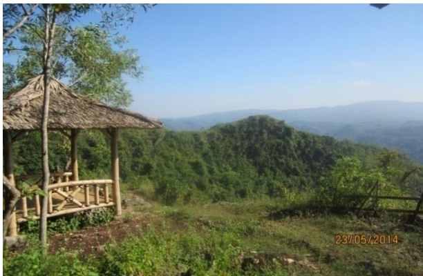
Gambar 1. Obyek Wisata Watu Payung

(seperti ditunjukkan pada Gambar 1) perlu dikelola secara serius karena merupakan salah satu dari tiga belas geosite (lokasi) di Gunungkidul yang merupakan bagian dari rencana pengembangan Global Geopark tiga kabupaten (Pacitan, Gunungkidul dan Wonogiri).