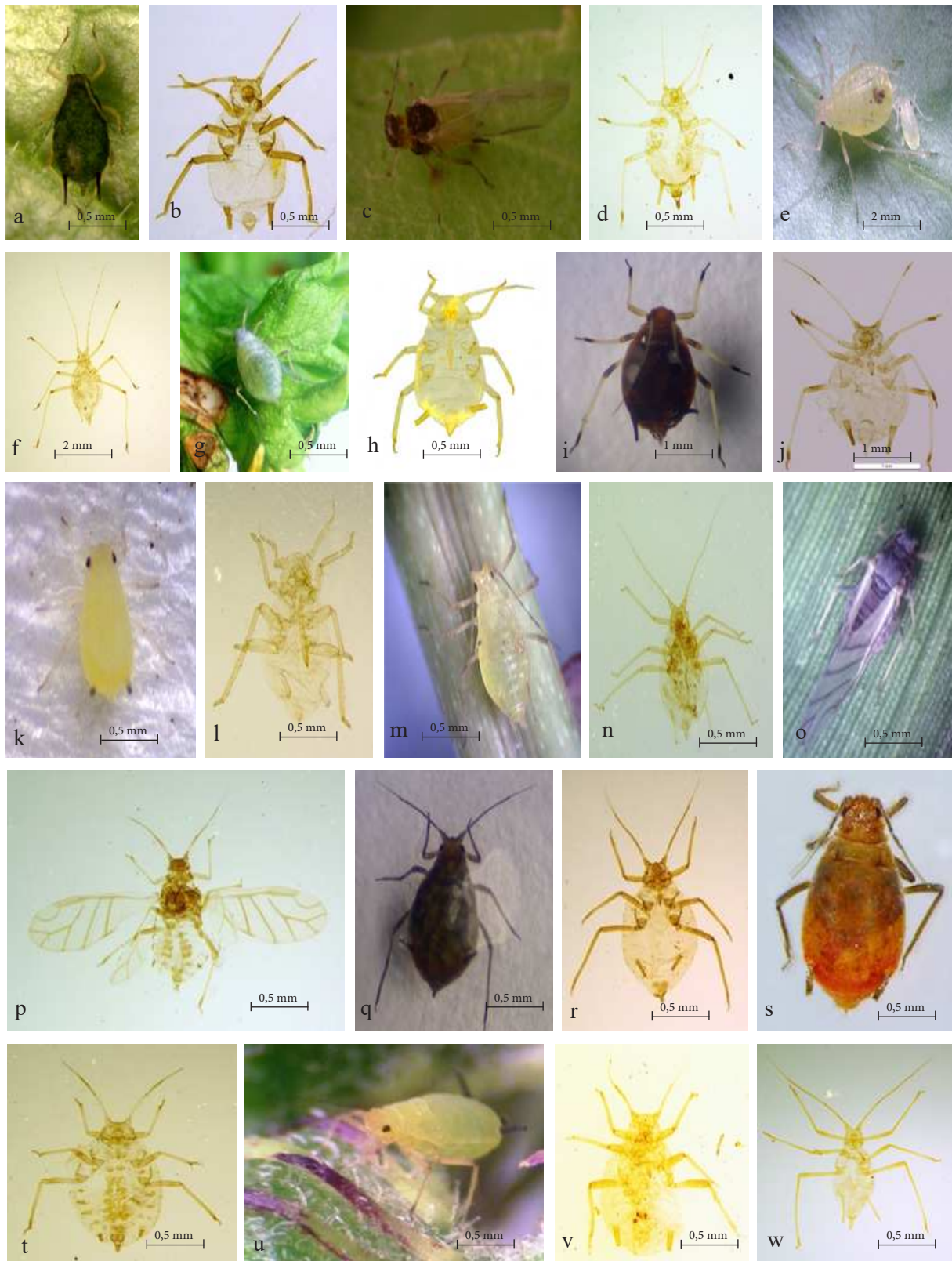
Gambar 1. Imago kutudaun a: Aphis gossypii ; b: mikroskopik A. gossypii ; c: Aphis spiraecola ; d: mikroskopik A. spiraecola ; e: Aulacorthum solani ; f: mikroskopik A. solani ; g: Epameibaphis frigidae ; h: mikroskopik E. frigidae ; i: Hysteroneura setariae ; j: mikroskopik H. setariae ; k: Melanaphis sorghi ; l: mikroskopik M. sorghi ; m: Metopolophium dirhodum ; n: mikroskopik M. dirhodum ; o: Pseudaphis sijui ; p: mikroskopik P. sijui ; q: Rhopalosiphum padi ; r: mikroskopik R. padi ; s: Rhopalosiphum rufiabdominale ; t: mikroskopik R. rufiabdominale ; u: Schizaphis graminum ; v: mikroskopik S. graminum ; w: mikroskopik Sitobion leelamaniae .