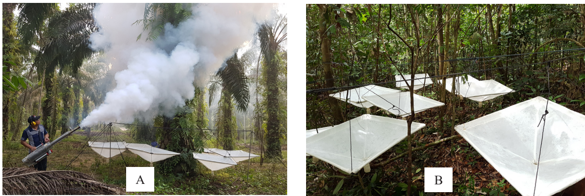
Gambar 2. Pengambilan sampel serangga di lapangan. A: pelaksanaan pengasapan; B: wadah untuk menampung serangga yang mati.

Jumlah keseluruhan kumbang curculionid yang dikoleksi adalah 12 subfamili, 118 spesies, dan 1762 individu. Hutan memiliki persentase jumlah spesies yang paling banyak dikoleksi (68,64%) dan koleksi terendah terdapat pada perkebunan karet (16,94%). Kelimpahan individu tertinggi terdapat pada perkebunan kelapa sawit (853 individu) dan terendah pada perkebunan karet (33 individu) (Tabel 1). Kumbang curculionid umumnya menyukai musim hujan dibandingkan dengan musim kemarau. Hal ini terlihat pada tipe penggunaan lahan hutan karet dan perkebunan kelapa sawit. Hutan karet menunjukkan jumlah morfospesies kumbang curculionid meningkat seiring dengan peningkatan jumlah individu curculionid, sedangkan perkebunan kelapa sawit menunjukkan hasil sebaliknya antara jumlah morfospesies dan jumlah individu curculionid