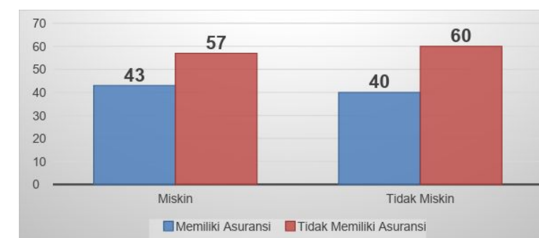
Gambar 3: Proporsi Kepemilikan Asuransi Kesehatan Berdasarkan Status Ekonomi Rumah Tangga