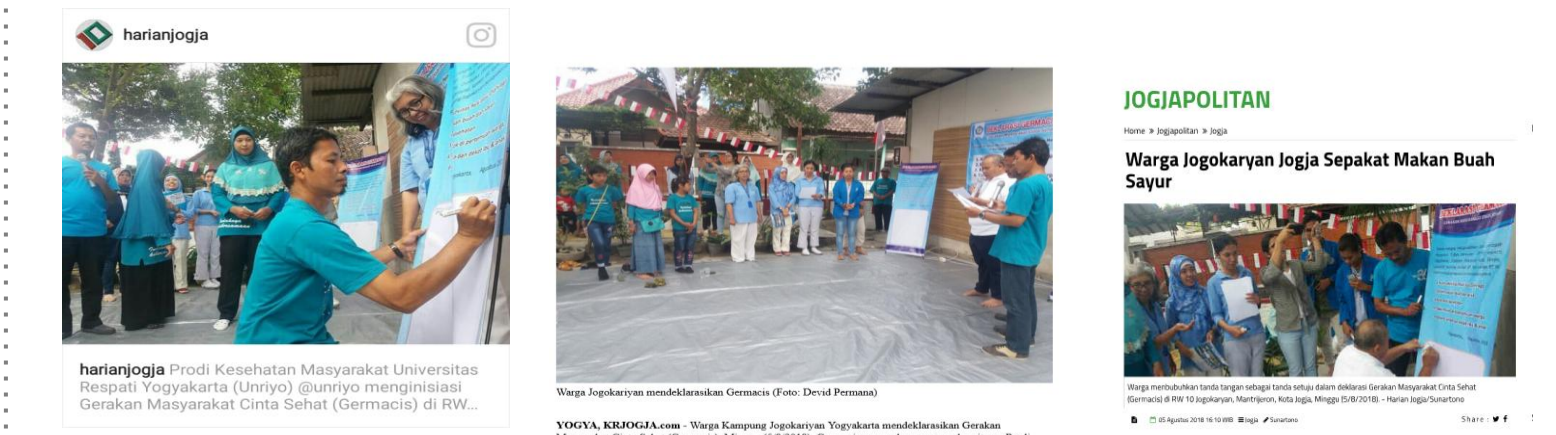
Gambar 3. Publikasi Deklarasi Germacis pada Media Koran (Harianjogja, Kadaulatan Rakyat, Jogjapolitan)

Program Germacis berjalan dengan lancar sesuai dengan tahapan yang telah direncanakan. Tantangan pelaksanaan program germacis adalah pentingnya meningkatkan kesesuaian antara atribut inovasi (program), karakteristik individu atau organisasi yang mengadopsi program, dan kondisi lingkungan atau konteks dimana proses implementasi program berlangsung. Program germacis sangat mungkin direplikasi pada lokasi yang lain dengan memperhatikan karakteristik masyarakat, dan faktor pendukung (sosial kapital) yang dimiliki masyarakat setempat sehingga program dapat berhasil.