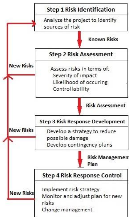
Gambar 1. Risk Management Process