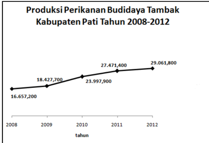
Gambar 2. Produksi Perikanan Budidaya Tambak Kabupaten Pati

perikanan budidaya tambak Kabupaten Pati dengan total hasil perikanan budidaya tambak di Provinsi Jawa Tengah disajikan pada Tabel 2.