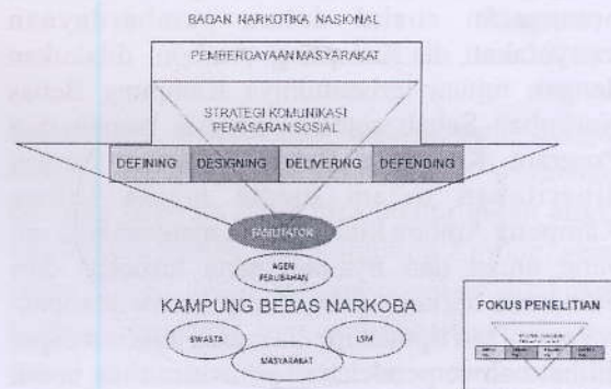
Gambar 1. Kerangka Alur Pemikiran

Dalam upaya memengaruhi masyarakat untuk pemberdayaan masyarakat, salah satu pendekatan yang sering digunakan adalah pemasaran sosial. Dalam pandangan Kotler dan Roberto (1989), pemasaran sosial mengedepankan penggunaan teknik dan strategi komunikasi dalam menyebarluaskan ide baru dalam komunitas/kelompok.