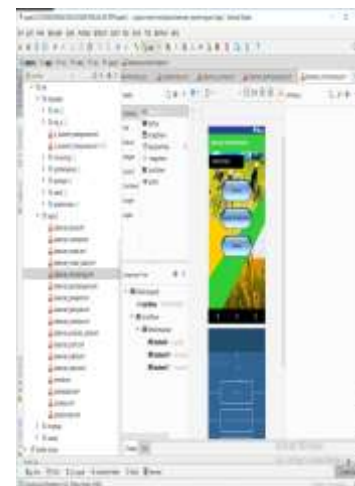
Gambar 3 Tampilan Halaman Monitoring

Tampilan halaman pembelajaran adalah tampilan yang akan ditampilkan setelah menu pembelajaran pada tampilan halaman utama digunakan.