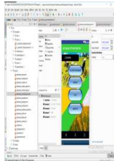
Gambar 4.3. Tampilan Halaman Pembelajaran

Tampilan halaman utama adalah tampilan yang akan ditampilkan setelah aplikasi menampilkan tampilan splashscreen.