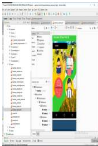
Gambar 2. Tampilan Halaman Utama

Tampilan Splash Screen adalah tampilan yang akan ditampilkan pertama kali pada saat aplikasi dijalankan pada smartphone android.