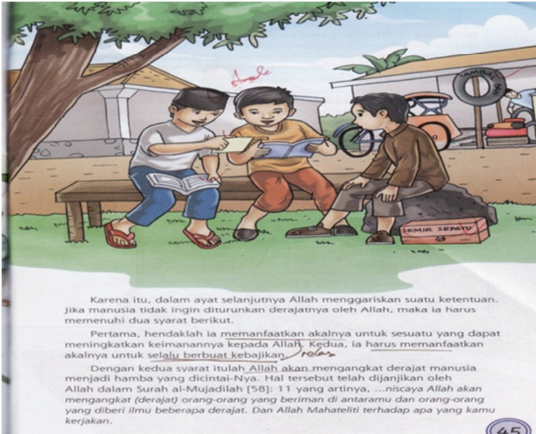
Gambar 2. Teks tafsir surat al-Tin dengan ilustrasi yang dapat menyampaikan banyak makna, yaitu makna yang lebih dari sekedar makna yang disampaikan oleh teks.

Berikut ini salah satu bagian tafsir visual sebagai wujud dari kolaborasi yang dibangun oleh mufasir dan ilustrator yang menunjukkan bagaimana teks dan ilustrasi saling bekerja sama untuk menjelaskan suatu pesan yang dikandung al-Qur'an.