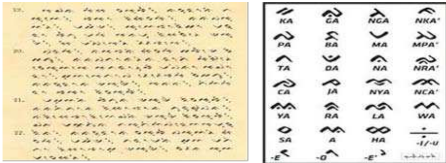
Gambar 1: Aksara Lontara Bugis

(adat istiadat) mengenai norma yang berkaitan satu sama lain. Setelah masuknya Islam dikenallah istilah sara' (syariat Islam) yang menjadi bagian dari adat-istiadat Bugis. Dari sistem itu dibentuk pula perangkat pejabat sara' ( parewa sara' ) yang menangani urusan keagamaan secara resmi disebut sebagai kali (qhadi') yang juga merupakan penasehat kerajaan dalam persoalan keagamaan. 9