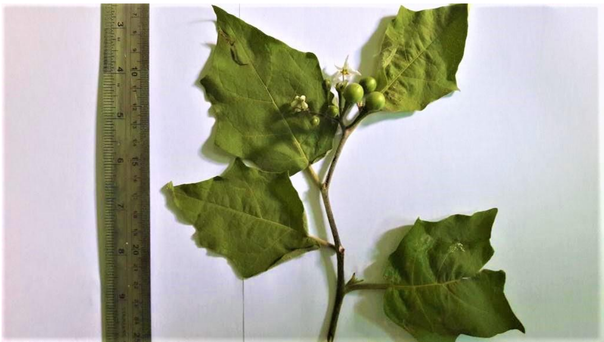
Gambar 2. Morfologi batang dan buah rimbang yang digunakan pada penelitian

masyarakat adalah ekstraksi menggunakan pelarut akuades. Secara tradisional di masyarakat, teknik rebusan adalah cara ekstraksi yang umum dilakukan untuk mengolah tanaman obat (Alfarabi & Fauziyuningtias, 2017). Teknik tersebut terdapat kekurangan bila dibandingkan melakukan ekstraksi menggunakan pelarut kimia organik, yaitu senyawa yang terekstrak lebih banyak senyawa bersifat polar sesuai dengan polaritas air sebagai pelarut dan senyawa yang tidak tahan panas akan rusak dikarenakan proses merebus biasanya dilakukan pada temperatur 100 °C.