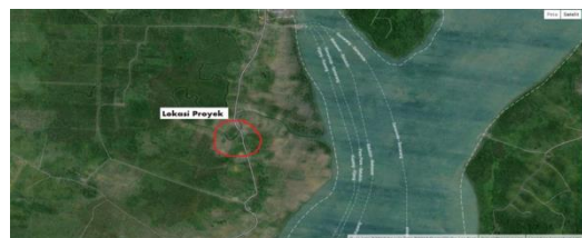
Gambar 2. Peta Lokasi Tampak Satelit

Penelitian ini dilakukan pada proyek Pengaspalan Jalan Sepunggur – Gunung Tinggi Kabupaten, Tanah Bumbu yang merupakan jalan penghubung dari jalan lintas provinsi ke kantor bupati Kabupaten Tanah Bumbu. Dibawah ini gambaran lokasi proyek tersebut.