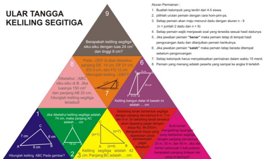
Gambar 1. Ular Tangga Segitiga Materi Keliling Segitiga

Sedangkan ular tangga segitiga materi luas segitiga adalah sebagai berikut :