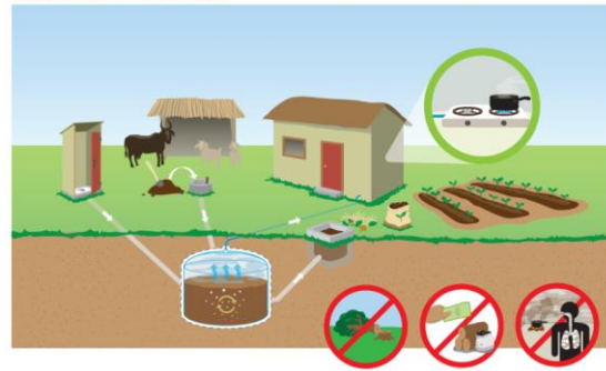
Gambar 1. Digester Biogas