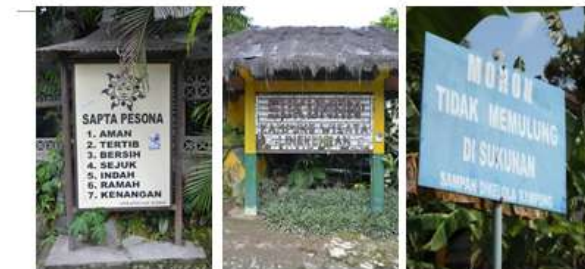
Gambar 3. Papan Tanda di Kampung Sukunan (Sumber : survey, 2014)

Pemilihan sistem pengelolaan sampah swakelola di Kampung Sukunan bertujuan untuk menangani permasalahan sampah secara mandiri oleh masyarakat, oleh karena itu pemulung tidak diijinkan masuk di lingkungan Kampung Sukunan. Dengan adanya sistem tersebut diharapkan akan tumbuh kesadaran masyarakat dalam menjaga lingkungan dan memperkuat rasa kepemilikan akan Kampung Sukunan sehingga warga akan lebih memberikan perhatian penuh terhadap kebersihan dan keindahan lingkungan tempat tinggal mereka.