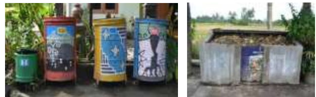
Gambar 4. Bak Pemilahan Sampah pada Kampung Sukunan