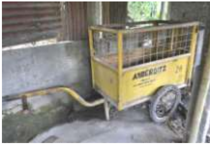
Gambar 6. Gerobag sampah sebagai alat angkut menuju TPS

Gerobag sampah di atas merupakan hasil sumbangan dari Pemerintah Kab. Sleman. Namun pengadaan gerobag sampah tersebut ada setelah sistem pengelolaan sampah swakelola di Kampung Sukunan telah berjalan dengan baik, dengan kata lain respon dari Pemerintah baru ada setelah program tersebut terbukti dapat berjalan dan sukses.