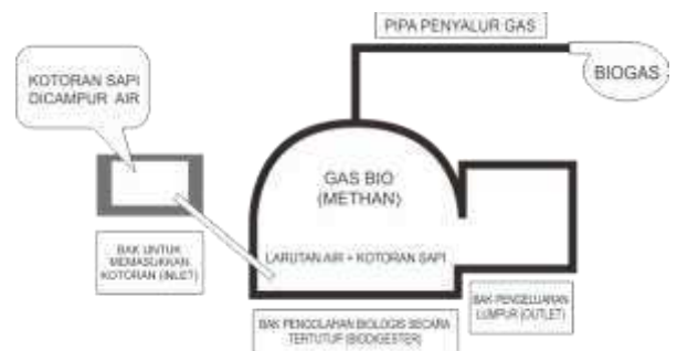
Gambar 9. Instalasi Biogas Kampung Sukunan

Dari gambar 8 di atas, tampak bahwa pengelolaan sampah di Kampung Sukunan telah tersistem dengan baik, mulai dari pengelolaan sampah di tingkat masing-masing rumah tangga hingga tingkat Kampung yang membawahi 5 RT. Pengelolaan sampah yang dilakukan tidak hanya mencakup 3R (reduce, reuse, recycle) atau pengurangan, penggunaan kembali dan daurulangan, namun juga recovery / pemulihan yang tampak dari pengolahan limbah cair dengan menggunakan IPAL, sehingga limbah cair rumah tangga yang kurang bersahabat dengan lingkungan dapat diolah terlebih dahulu untuk kemudian menjadi aman bagi lingkungan sebelum dialirkan kembali ke alam; penggunaan sampah padat yang tidak berbahaya seperti sisa bahan bangunan dll sebagai bahan urugan tanah; serta pengubahan energi / energy conversion berupa biogas yang mengubah sampah berupa kotoran ternak menjadi energi panas / api (dapat dilihat di Gambar 9).