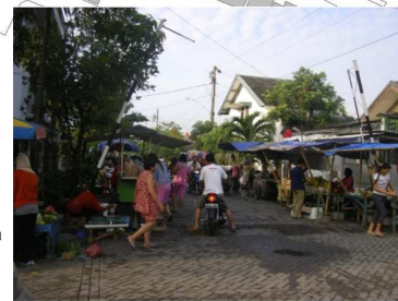
situasi pasar pada jalan arya mukti raya pasar sepo tong- sepo tong di antara entrance rumah