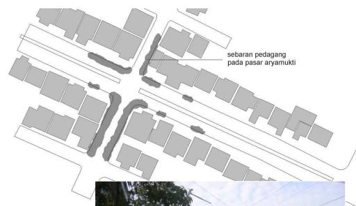
situasi pasar pada jalan arya mukti selatan. Los pasar memenuhi jalan

Para penjual berasal dari beberapa tempat yang berbeda. Beberapa penjual masakan merupakan penghuni perumahan itu sendiri yang memanfaatkan pasar untuk berwiraswasta. Bahkan satu penjual masakan di jalan aryamukti raya memanfaatkan tempat di muka rumahnya sendiri untuk berjualan masakan, kebetulan rumahnya terletak tidak jauh dari perempatan tersebut. Penjual buah, penjual sayuran dan “blanja”, penjual gethuk merupakan penghuni perkampungan di