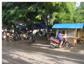
satu tenda digunakan bersama oleh beberapa pedagang