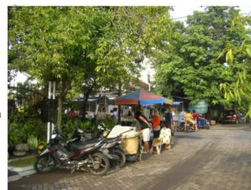
Gambar 2. Pasar Lingkungan di Aryamukti