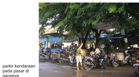
parkir kendaraan pada pasar di ganesya.