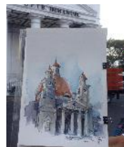
sketsa oleh artyan trihandono, 2016

Objek bangunan di kota lama kota Semarang yang menjadi favorit untuk menjadi objek sketsa dapat dibagi menjadi 2 tipe, tipe bangunan dan tipe koridor jalan. Sketsa tipe bangunan lebih fokus pada menggambar sketsa 'karakter bangunan', sedangkan tipe koridor adalah upaya untuk menggambarkan suasana kegiatan di sepanjang jalan tersebut. Di kota lama kota Semarang ada beberapa bangunan dan koridor jalan yang menjadi objek favorit bagi para sketcher. Salah satunya adalah gereja blenduk yang menjadi center of activity dalam pengembangan kawasan pelestarian kota lama. Berikut beberapa karakter sketsa gereja blenduk yang menjadi magnet daya tarik wisata kota lama.