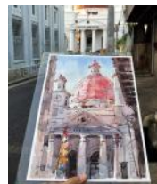
sketsa oleh vanont ruk, 2016