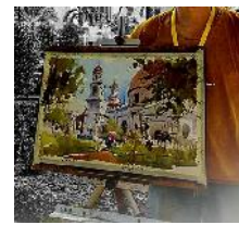
sketsa oleh Kooh Cheang Jin, 2016