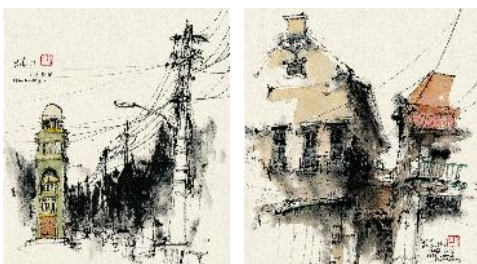
sketsa KK : koridor jalan merak, 2016

Selain tipe bangunan tunggal ada beberapa sketsa tipe koridor jalan yang ada di kota lama Semarang adalah sebagai berikut :