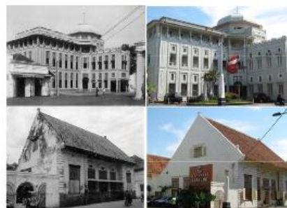
Gambar : Bangunan di kota lama Semarang

Kawasan Kota Lama Semarang merupakan cikal bakal terbentuknya Kota Semarang. Penggunaan lahan yang mendominasi kawasan Kota Lama adalah bangunan non aktif dengan intensitas bangunan tergolong tinggi. Gaya bangunan yang mendominasi kawasan Kota Lama berupa gaya kolonial. Kawasan Kota Lama merupakan kawasan bersejarah dengan nuansa Belanda (little netherland). Kawasan tersebut dibentuk oleh koridor utama Jl. Letjend Suprpto yang membelah kawasan menjadi dua bagian, dengan batas kawasan berupa Kali Semarang di sebelah barat dan deretan bangunan berarsitektur kolonial di sepanjang Jl.