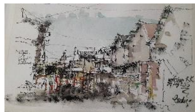
Gambar : sket dengan teknik twig, jalan perkutut KL Smg