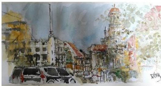
Gambar : sket dengan teknik watercolor sketch, taman srigunting KL Smg

Unsur-unsur yang menjadi pertimbangan dalam mengerjakan gambar sketsa adalah :