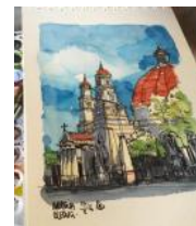
sketsa oleh arif setyawan, 2016