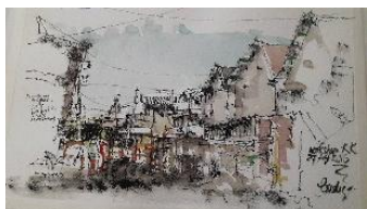
skets BS : koridor jl perkutut, 2016

Satu teknik menggambar sketsa dengan ranting bergoyang ( twig dancing ) sangat ekspresif menggambarkan fakta objek di lapangan, khususnya objek-objek yang karakter bangunannya sudah tidak terawat. Objek dalam keadaan kumuh dan lusuh yang menjadikan teknik twig dancing ini mampu menggambarkan fakta dalam sketsa secara maksimal.