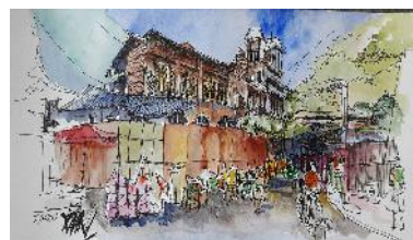
Gambar : Sket dengan teknik ‘line’ and ‘wash’, gedung kota tua (sumber : livesketch budisud 2016)