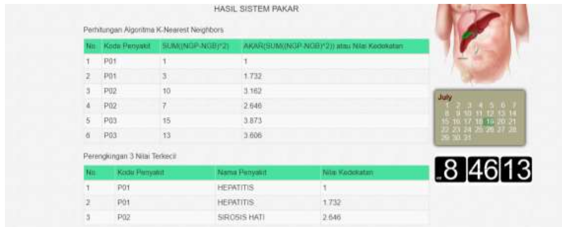
Gambar 7. Sistem Pakar Menggunakan K-Nearest Neighbors Algoritm

Sedangkan Pada Halaman User yang telah melakukan proses diagnosa penyakit akan muncul form hasil diagnosa penyakit pasien seperti pada contoh data dalam gambar 8 berikut :