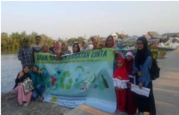
Gambar 3. Tim Pengabdian Kepada Masyarakat bersama Kader Bank Sampah Jembatan Cinta

Kemudian sesi beralih kepada narasumber ke dua, yaitu pemaparan tentang kelengkapan yang diperlukan dalam Bank Sampah. Di antaranya terkait pembuatan tata tertib nasabah; pembuatan buku laporan keuangan nasabah yang dipegang oleh kader; kemudian pembuatan buku tabungan, dan pembuatan jurnal rkapen penimbangan. Pada sesi ini kader diberitahu tentang daftar harga barang (sampah) dalam satuan kilogram, kemudian harga sampah gambrud atau campuran, jika semua sampah yang terkumpul digabungkan penyimpanannya tanpa adanya pemilahan.