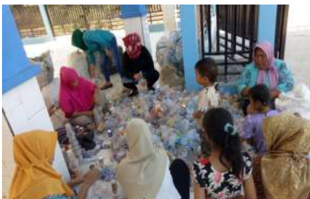
Gambar 4. Aktivitas Penimbangan Perdana Bank Sampah Jembatan Cinta

Dalam penimbangan perdana ini terkumpul berbagai jenis sampah (gambar 4) yang sudah disetor oleh para nasabah Bank Sampah Jembatan Cinta yang ada di Desa Segarajaya, di antaranya: sebanyak 28,85 kg sampah kardus terkumpul, kemudian kertas duplex sebanyak 2,2 kg, aluminium sebanyak 1,2 kg, gelas plastik bersih sebanyak 9 kg, botol plastik bersih sebanyak 28 kg, baja ringan sebanyak 12,9 kg, emberan sebanyak 2 kg, dan gabrug atau sampah campuran sebanyak 27,5 .