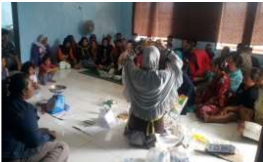
Gambar 1. Pengenalan Jenis-jenis Sampah

terpisah. Untuk botol kecap tidak perlu diremas dan penyimpanannya digabung dan dikumpulkan bersama botol-botol plastic lainnya yang sejenis. Untuk sampah jenis kotak minuman, seperti bekas the atau susu kemudian dikeluarkan sisa-sisa airnya, dilepas tutupnya, lalu kotaknya dilipat, dan disimpan di tempat yang berbeda. Jenis botol beling dihitung persatuan, sedangkan jenis gelas beling bening dihitung perkilo. Panic-panci rusak atau perabotan rumah tangga bisa juga ditabung di Bank Sampah. Kemudian buku-buku tulis anak yang sudah tidak terpakai kemudian dibuka jilidnya, dan dikumpulkan dengan sampah kertas yang sejenis. Bisa dilihat pada gambar 1 berikut