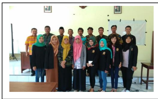
Gambar3.Foto Bersama Peserta danTim Pengabdi