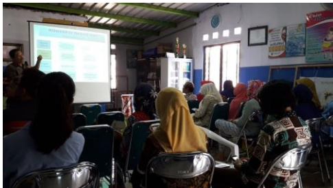
Gambar 3 Instruktur Memberikan Penjelasan Konsep Dasar HaKI

dapat dipertahankan secara efektif dan dimanfaatkan dengan aman.