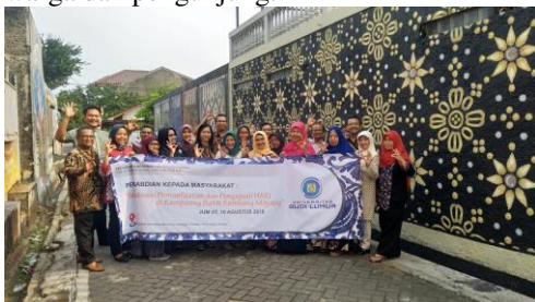
Gambar 4 Tim Pelaksana PKM Berfoto Bersama Para Perajin Batik

Tim pelaksana PKM melakukan foto dengan pose salam canting sebagai salam khas perajin batik Sanggar Batik Kembang Mayang setelah selesai mengikuti acara sosialisasi pada pagi dan siang harinya. Pada sekitar lokasi Sanggar Batik terlihat beberapa tembok yang dilukis dengan corak batik kembang yang sarat ciri khas budaya Tangerang Banten. Corak kembang mayang tersebut merupakan hasil kreasi para perajin batik yang di- display di sepanjang tembok rumah-rumah warga menuju sanggar batik. Kegiatan ini sangat menarik karena berhasil menghilangkan kebiasaan vandalism anak-anak muda yang suka mencorat-coret tembok, menjadikan pemandangan menarik di sekitar sanggar, dan menjadi latar foto para warga dan pengunjung.