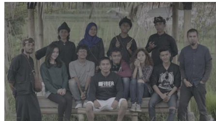
Kampung Nde lebih mandiri dalam meningkatkan promosi pariwisata kampung Nde.

Dari tiga pelatihan yang dilakukan, penulis berharap masyarakat