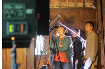
Gambar 5 Kegiatan Pelatihan Teknik Pengambilan gambar di Kampung Nde.

mempromosikan wisata alam dan budaya di daerah mereka tinggal.