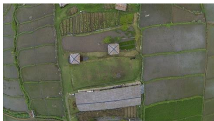
Gambar 3 Sawah di area Kampung Nde

Budaya di musim tanam dan musim panen juga dapat ditonjolkan. Perekaman dilakukan guna menangkap nilai gotong royong, rasa syukur, dan saling memberi terhadap sesama manusia dan alam. Nilai-nilai tersebut merupakan nilai yang sangat dirindukan oleh masyarakat kota yang lebih individual dan jauh dari alam pedesaan dan hutan. Seluruh tipe angle kamera dapat dikombinasikan untuk menangkap beberapa kesan yang berbeda. Komposisi gambar dari ritus yang dilakukan oleh masyarakat setempat dapat juga direkam dari berbagai komposisi. Mulai dari long shoot sampai over shoulder shoot dapat dikombinasikan sebagai upaya menangkap kesan bahwa penonton masuk ke dalam ritual kebudayaan dari