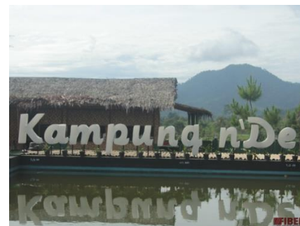
Gambar 1 Kampung Nde dengan latar Gunung

Beberapa temuan yang dapat dikumpulkan oleh penulis untuk kemudian dijadikan dasar dalam kegiatan pengabdian masyarakat, akan dipaparkan dalam bab ini. Temuan data ini merupakan hasil dari pengamatan mengenai potensi budaya dan alam yang dapat dijadikan mise en scene dari sinematografi yang kemudian dapat memberikan dampak yang positif bagi promosi pariwisata Kampung Ende, Kabupaten Cianjur, Jawa Barat. Beberapa potensi budaya dan alam yang dapat dijadikan mise en scene tersebut akan dianalisis dengan kemungkinan sudut pengambilan gambar yang dapat mengungkapkan nilai dramatis dari objek tersebut.