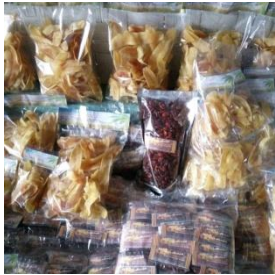
Gambar 1. Hasil pengemasan produk

Kegiatan pengabdian kedua memberikan informasi kepada masyarakat tentang pembuatan merk produk. Tujuan pembuatan merk untuk mengenalkan nama produk, agar tidak digunakan oleh orang lain. Masyarakat membuat bersama-sama merk produk yang akan dijual dan memilih kemasan yang baik.