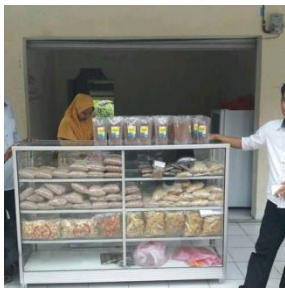
Gambar 2: Display hasil produk setelah dikemas

Kegiatan pengabdian ketiga, setelah dilakukan pengemasan oleh-oleh menggunakan bahan dan merk yang menarik, maka kegiatan selanjutnya melakukan penjualan di sekitar desa. Hal tersebut untuk mengukur minat masyarakat terhadap hasil kegiatan pengabdian masyarakat ini. Penjualan dilakukan di toko-toko sekitar Desa Jiput dengan menggunakan etalase sebagai tempat display produk.