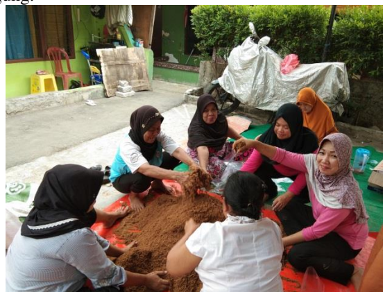
Gambar 2. Proses pembuatan media jamur tiram

Semua peserta pelatihan belum mengenal media tanam jamur tiram, sehingga tertarik melakukan budidaya. Setelah melakukan pelatihan peserta mengetahui bahan yang dapat dijadikan media tanam jamur tiram. Utama et al. (2013) media tumbuh dengan hasil terbaik untuk pembuatan bibit induk jamur tiram putih adalah biji jagung.