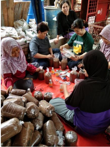
Gambar 3. Proses Inokulasi Bibit Jamur Tiram

Seluruh peserta pelatihan baru memahami cara budidaya jamur tiram setelah mengikuti setiap tahap pelatihan dengan antusias karena merupakan pengetahuan dan ketrampilan yang baru mereka kenal secara langsung yakni dari tahapan menyiapkan tempat dan bahan, membuat media tanam (baglog) dan inkubasi, sterilisasi media tumbuh (baglog), inokulasi bibit dan pemeliharaan.