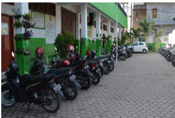
Gambar 1: Melakukan survey di SD Muhammadiyah 23 Medan.

Ketiga , Mengadakan pertemuan dengan kepala sekolah SD Muhammadiyah 23 Medan. Pertemuan ini dilakukan pada hari Senin, 21 Februari 2018. Dalam pertemuan ini panitia beserta Pimpinan Cabang Muhammadiyah (PCM) Medan Denai, melakukan koordinasi mengenai tempat atau ruangan yang akan digunakan, masalah administrasi dan lain sebagainya. Pada pertemuan ini panitia juga memberikan informasi kepada kepala sekolah terkait waktu pelaksanaan Program Kemitraan Pengembangan Muhammadiyah (PKPM) tersebut dan jumlah peserta dari setiap masing-masing utusan yang telah ditentukan oleh panitia atas saran dari Pimpinan Cabang Muhammadiyah (PCM) Medan Denai.