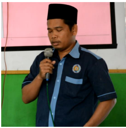
Gambar 6: Ketua Panitia PKPM, memberikan kata sambutan

merupakan program pengabdian kepada masyarakat khususnya kepada warga Muhammadiyah. Universitas Muhammadiyah Sumatera Utara, setiap tahun memberikan dana untuk melakukan pengabdian masyarakat kepada para dosen, yang tujuannya untuk meningkatkan sumber daya manusia. Untuk itu diharapkan program ini dapat dimanfaatkan dengan sebaik mungkin oleh tiap-tiap peserta.