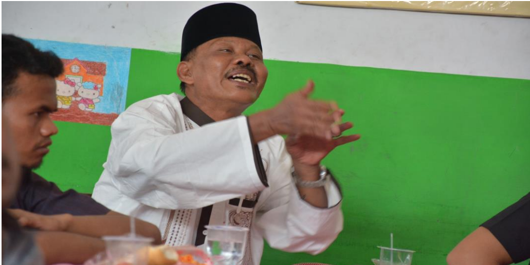
Gambar 11: Salah seorang peserta pelatihan mengajukan pertanyaan terkait masalah pengakurasian arah kiblat.