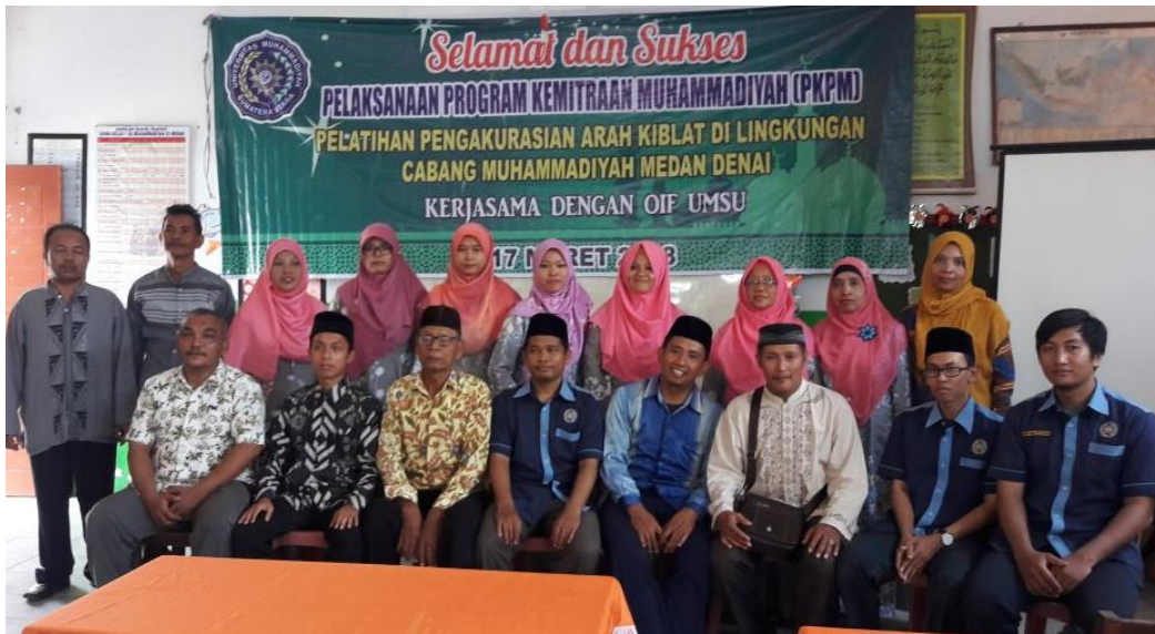
Gambar 13: Kegiatan foto bersama dengan sebagian peserta pelatihan pengakurasian arah kiblat di Kecamatan Medan Denai.