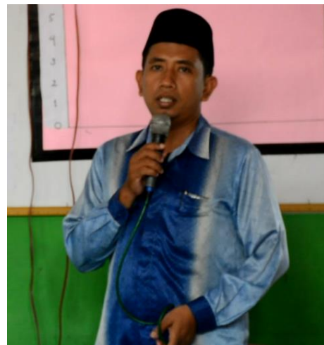
Gambar 5: Pimpinan Cabang Muhammadiyah (PCM) Medan Denai, membuka acara.

memberikan apresiasi besar atas terselenggaranya kegiatan Program Kemitraan Pengembangan Muhammadiyah (PKPM) ini, dan beliau juga berharap kegiatan seperti ini dapat dilaksanakan minimal setahun sekali.