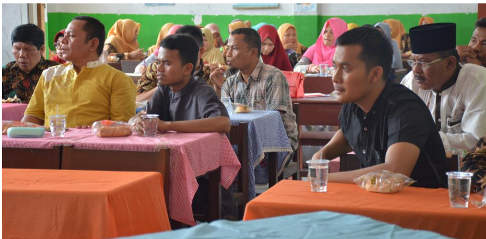
Gambar 10 : Peserta sedang mengamati cara penggunaan alat-alat yang dapat digunakan sebagai pengakurasian arah kiblat.

Kemudian setelah dijelaskan secara teori tentang pentingnya melakukan pengakurasian arah kiblat, bagaimana teknik dan tata cara melakukannya, serta bagaimana menggunakan alat-alat tertentu untuk