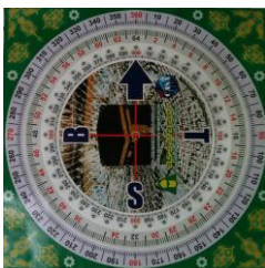
Gambar 3: Kompas Kiblat