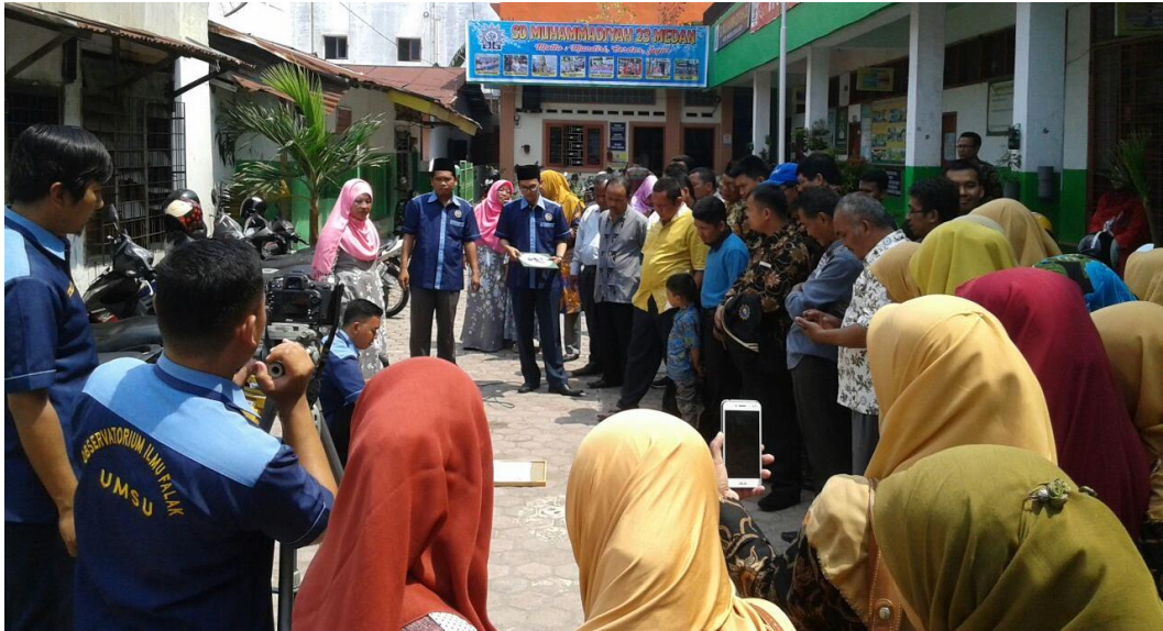
Gambar 12: Praktek penggunaan alat di lapangan.

digunakan dalam mengakurasi arah kiblat. Hal ini karena theodolite memiliki tingkat akurasi yang sangat tinggi.