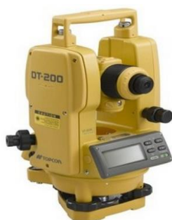
Gambar 4: Teodolite

Selain itu, panitia juga mempersiapkan snack dan konsumsi bagi peserta yang mengikuti pelatihan pengakurasian arah kiblat di Kecamatan Medan Denai. Hal ini diberikan agar peserta pelatihan merasa nyaman dalam mengikuti Program Kemitraan Pengembangan Muhammadiyah (PKPM).