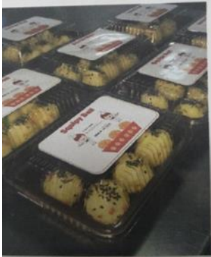
Gambar 1. Produk Squipy Ball

sayur kemungkinan enggan mencoba produk kami. Persaingan dalam usaha jika muncul usaha sejenis.