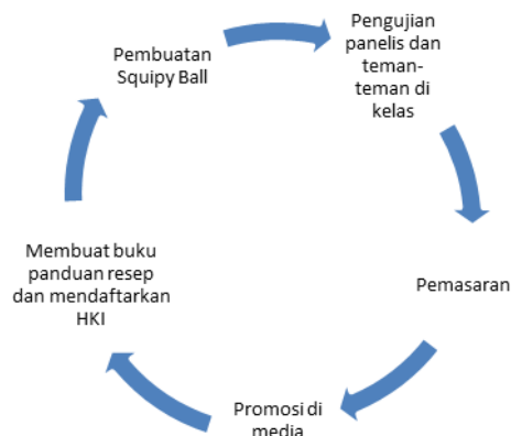
Diagram 2. Tahap pelaksanaan

Tahap pelaksanaan kegiatan Kreativitas Kewirausahaan Kemahasiswaan Squipy Ball yaitu: