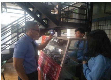
Gambar 2: Penjualan