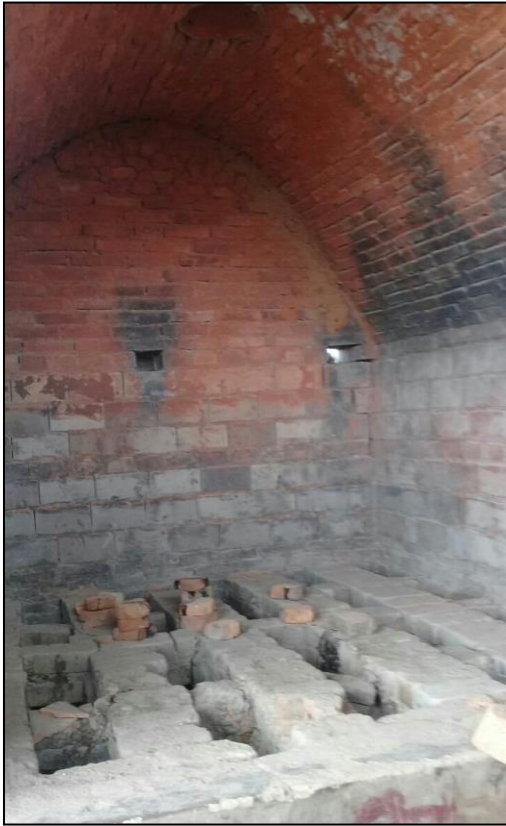
Gambar 2 Proses Pembakaran Gerabah di Desa Bumi Jaya