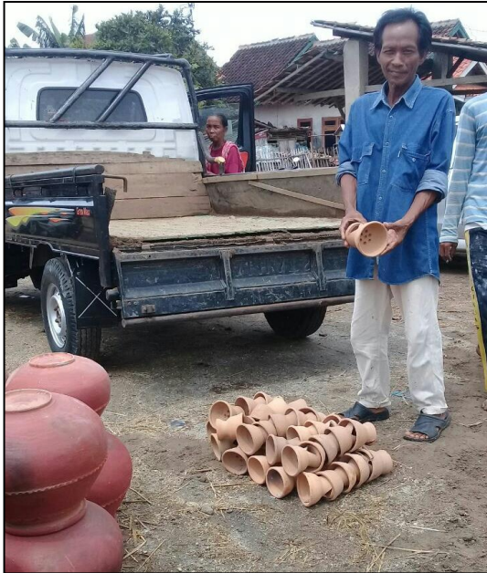
Gambar 1 Gerabah Desa Bumi Jaya