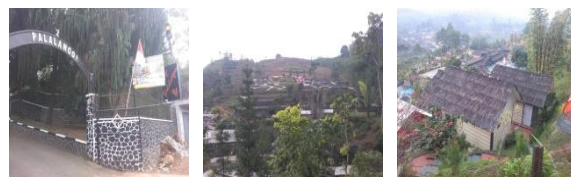
Gambar 1. Kawasan Desa Wisata

Dari hasil penelitian yang dilakukan di Kecamatan Pasirjambu Kabupaten Bandung, diperoleh data bahwa daerah tersebut memiliki potensi wisata alam yang menjadi daya tarik bagi para wisatawan. Hal itu dapat terlihat pada gambar berikut: