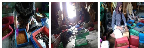
Gambar 2. Industri Susu Karamel Cisondari

Adapun objek wisata yang berdekatan dengan desa wisata Villa Palalangan adalah Berusan Hill yang merupakan kolaborasi arena rekreasi modern dengan fasilitas cukup lengkap untuk menghilangkan stres akibat kerja dan tempat bermain bagi anak-anak. Selain itu terdapat pula perkebunan teh gambung yang menyediakan berbagai macam fasilitas termasuk penginapan dan tempat bermain anak-anak. Perkebunan teh ini tadinya merupakan tempat penelitian teh dan kina dibawah naungan PTP. Perkebunan XIII.