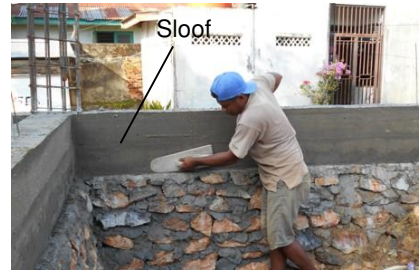
Gambar 1. Sloof pada bangunan Rumah Toko di Kota Kendari