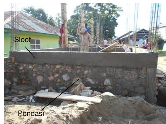
Gambar 2. Sloof dan pondasi batu gunung dibuat satu paket pada bangunan Rumah Toko di Kota Kendari

digunakan hanya untuk mengikat besi tulangan, sehingga ukuran besi tulangan perlu dibuat ukuran lebih besar dari besi behel. Koeksistensi ditemukan dalam besi tulangan perlu digunakan dengan ukuran lebih besar daripada besi behel.