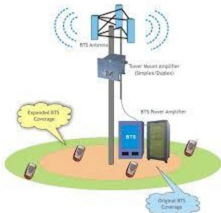
Gambar 1 Komponen BTS dan Cakupannya

Penelitian ini bertujuan untuk mengetahui dan mengevaluasi kebutuhan menara telekomunikasi yang dapat memenuhi kebutuhan komunikasi seluler masyarakat di Kabupaten Nunukan. Spesifikasi menara telekomunikasi pada penelitian ini dibatasi pada Base Tranceiver Station (BTS) makro dan mikro dengan spesifikasi antena omnidirectional dan tiga sektor serta jumlah carrier dibatasi sejumlah dua untuk penggunaan BTS makro. Selain itu, penelitian ini juga tidak membahas mengenai posisi penempatan BTS karena data wilayah pemukiman yang tidak berhasil didapatkan.