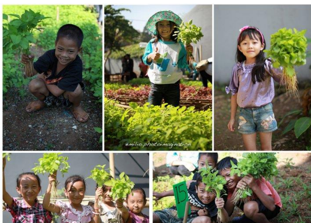
Gambar 3 : Kegiatan Berkebun oleh Komunitas BdgBerkebun

Menanam tanaman adalah salah satu cara lain untuk menunjukkan betapa anda peduli dengan lingkungan dengan cara yang sederhana atau hanya bergerak untuk mengatur, menggunakan kembali dan mendaur ulang sampah untuk menyelamatkan lingkungan. Hal ini akan menjadi lebih baik jika anda dapat menggunakan kembali sampah perkotaan sebagai bahan penyimpanan untuk berkebun.