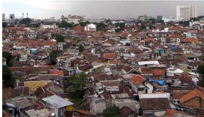
Gambar 2: Pemukiman Padat Penduduk Kota Bandung

Padatnya penduduk di daerah perkotaan, baik akibat urbanisasi maupun tingginya angka kelahiran menyebabkan sempit dan sesaknya daerah kota dan munculnya pemukiman-pemukiman penduduk yang baru. Hampir semua lahan kosong dijadikan tempat tinggal sedangkan lahan-lahan terbuka hijau hampir tidak terlihat. Tidak adanya celah untuk kegiatan urban agriculture mengurungkan minat masyarakat untuk membenahi lingkungan.