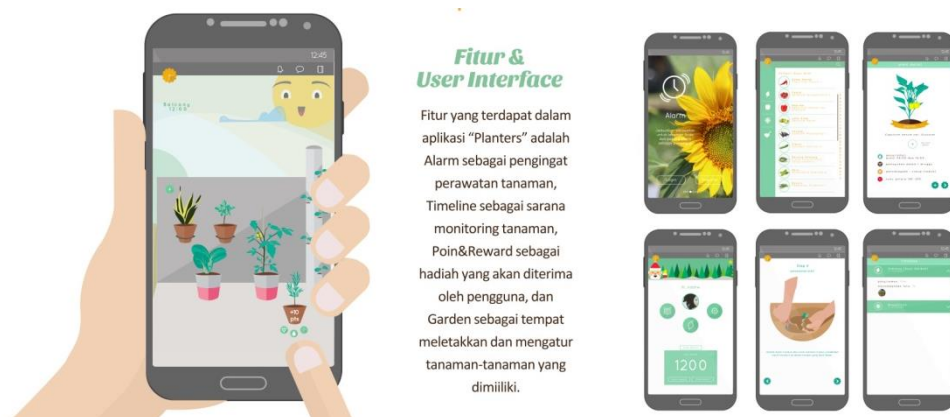
Gambar 5 : Mobile apps urban gardening

Urban agriculture dalam mobile apps tidak hanya digunakan untuk kepentingan pribadi atau kelompok, namun dapat digunakan secara meluas dengan menjadikannya sebuah kampanye dalam pelestarian lingkungan. Dengan menggunakan teori “A-A Procedure” yang dijabarkan menjadi Attention (perhatian), Interest (minat), Desire (keinginan), dan Action (tindakan) (Sadjiman, 2006: 12-13), diharapkan dapat menggugah keinginan pengguna serta melakukan kegiatan urban agriculture di wilayah perkotaan.