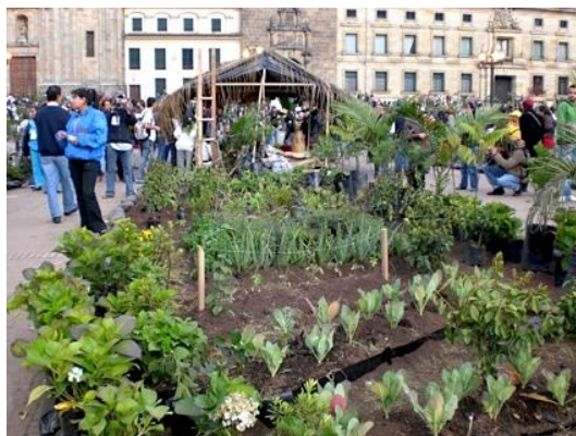
Gambar 1 : Urban agriculture di Kota New York

Kegiatan urban agriculture dapat dilakukan dengan cara bertani dan berkebun di daerah perkotaan. Dengan menanam sayuran, buah, tanaman, dan rempah-rempah atau tanaman lain untuk konsumsi masyarakat, pertanian dan aktivitas berkebun membantu dalam pelestarian lingkungan. Namun, kurangnya lahan untuk urban agriculture dapat menjadi penghalang untuk melakukan kegiatan ini. Jika pertanian perkotaan memiliki manfaat tambahan jika diimplementasikan, seperti masyarakat dapat menjadi penyedia makanan lokal dan menciptakan komunitas lokal.