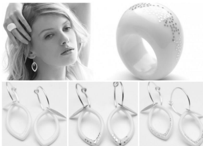
Gambar 2: Perhiasan Bone China karya Rikke Jacobsen

Perhiasan tersebut memiliki sifat yang hampir ringkih padahal sebenarnya lebih kuat dari jenis bahan keramik lainnya. Hal tersebut membuat keramik Bone China memiliki karakter unik dan anggun sebagai perhiasan.