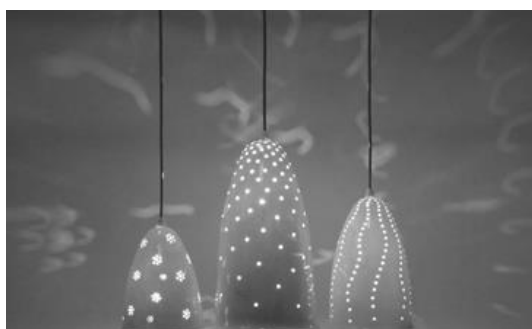
Gambar 2: contoh armature lampu keramik Bone China

Sejauh ini, keramik Bone China telah digunakan sebagai perhiasan oleh beberapa artisan keramik di dunia. Seperti yang dilakukan oleh Rikke Jacobsen yang dikenal telah membuat perhiasan menggunakan bahan Bone China dalam konsep gaya Scandinavian spirit . Semua koleksi perhiasannya merefleksikan konsep yang elegan, bersahaja dan indah (lihat gambar 2.)