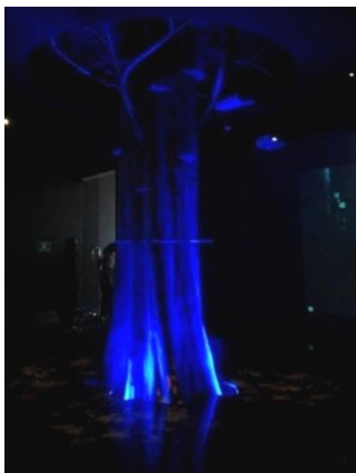
Gambar 4 : Skala Pohon dalam Ruang.

Apabila dilihat lebih dekat, dinding yang dijadikan layar proyeksi hanya ditutup dengan cat putih polos, ditambah sedikit relief di permukaan dindingnya yang berbentuk daun bergaris. Hal ini bisa terjadi karena dalam perancangan interior Museum Bank Indonesia, dinding tersebut sudah dirancang untuk dijadikan layar proyeksi video sehingga cukup memakai finishing cat putih polos. Setelah proyeksi dinyalakan, maka proyeksi itulah yang menjadi finishing dinding, atau wall treatment .