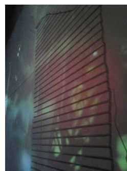
Gambar 6 : Relief Berbentuk Daun. Yang dibuat dari komposisi garis di dinding, dicat putih polos