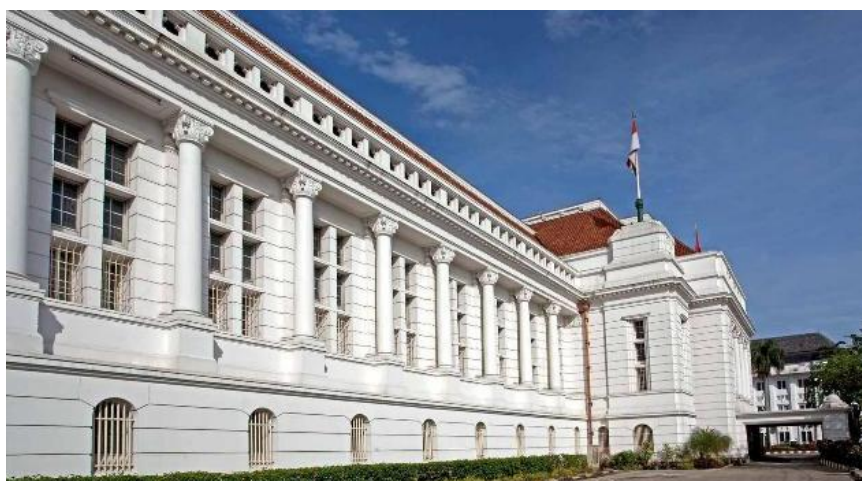
Gambar 1 : Museum Bank Indonesia, Kota Tua, Jakarta.

Dari kelima museum yang ada di Kota Tua, Museum Bank Indonesia merupakan satu-satunya museum yang menggunakan teknologi digital dalam memamerkan koleksi dan menyampaikan informasi. Menurut survey pada beberapa pengunjung, museum ini merupakan salah satu museum yang sangat menarik di mata pengunjung. Teknologi digital yang ada di dalam Museum Bank Indonesia adalah : Touchscreen Interactive media (layar sentuh dengan pilihan informasi), komposisi permainan cahaya, layar monitor (video film dan narasi), dan proyeksi video di ruang pameran terakhir sebelum masuk ke innercourt . Peran proyeksi video di ruangan ini terasa berbeda dengan peran teknologi digital lainnya yang ada di Museum Bank Indonesia. Saat teknologi digital lainnya berfungsi sebagai sumber informasi, proyeksi video ini mengemban fungsi utama lain.