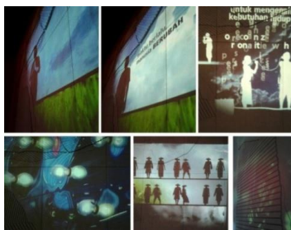
Gambar 5 : Konten Visual dalam Video.

Apabila dilihat lebih dekat, dinding yang dijadikan layar proyeksi hanya ditutup dengan cat putih polos, ditambah sedikit relief di permukaan dindingnya yang berbentuk daun bergaris. Hal ini bisa terjadi karena dalam perancangan interior Museum Bank Indonesia, dinding tersebut sudah dirancang untuk dijadikan layar proyeksi video sehingga cukup memakai finishing cat putih polos. Setelah proyeksi dinyalakan, maka proyeksi itulah yang menjadi finishing dinding, atau wall treatment .