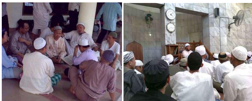
Gambar 5: Sedang melakukan “Bayan”

Penggunaan ruang yang sama juga dilakukan oleh anggota jamaah ini, seperti saat bayan, konsep ruang dimunculkan dengan duduk bersila membentuk kumpulan (lingkaran) dengan seorang yang mengutarakan materi tentang islam (konsep ruang guru dan murid). Selain itu penggunaan masjid sebagai tempat untuk menginap, atau bahkan rumah penduduk yang mau menerima mereka, digunakan bersama-sama untuk melaksanakan aktivitas religius, seperti berzikir, ibadah sholat, bayan serta bermusyawarah.