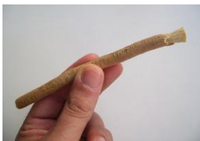
Gambar 4: Kayu siwak, untuk membersihkan gigi