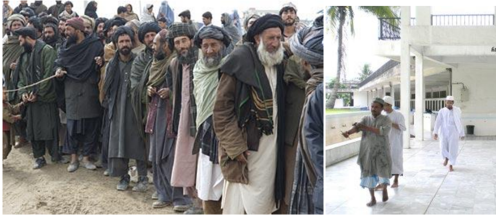
Gambar 2 1. Afghani Clothes yang dipakai oleh orang Afghanistan, 2. para Karkun di Indonesia