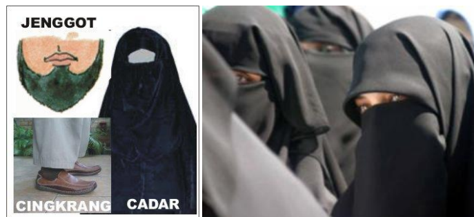
Gambar 3 Jenggot untuk laki-laki menggunakan celana cingkrang (kutung), niqab /cadar bagi wanita

Bagi perempuan tidak ada penampilan fisik yang khusus, karena seluruh tubuh mereka ditutupi oleh jilbab dan cadar.