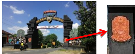
Gambar 6: Logo Ponorogo yang terdapat pada gapura pembatas kota.

Pada simbol visual yaitu logo Ponorogo juga terlihat penampang Reog sebagai salah satu bagian dari logo tersebut. Penampang Reog melambangkan kesenian asli dan sejarah besar Reog yang ditimbulkan oleh kerajaan-kerajaan lama Ponorogo (Kelana Sewandana) yang mengandung kepahlawanan (heroik). Jalur lima (lingkaran berwarna kuning) dan trap empat (garis berwarna merah), mengesankan angka 45 dari tahun 1945 yang bersejarah, yakni tahun kejayaan dan lahirnya proklamasi Kemerdekaan RI.