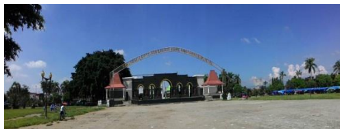
Gambar 4: Alun-alun Ponorogo

Dari hasil wawancara kepada pengunjung dan penduduk Kabupaten Ponorogo, simpul yang mencitrakan Ponorogo adalah Alun-alun Ponorogo