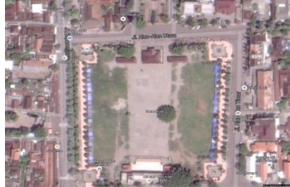
Gambar 3: Alun-alun Ponorogo

Dari hasil wawancara kepada pengunjung dan penduduk Kabupaten Ponorogo, kawasan yang mencitrakan Ponorogo adalah alun-alun Ponorogo