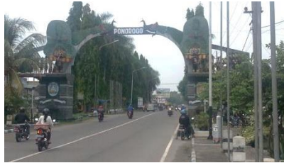
Gambar 2: Jalan Ponorogo-Geger

Dari hasil wawancara kepada pengunjung dan penduduk Kabupaten Ponorogo, jalur yang mencitrakan Ponorogo adalah Jalan Ponorogo-Geger