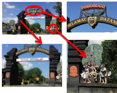
Gambar 1: Gapura pembatas kota Ponorogo dari arah Wonogiri