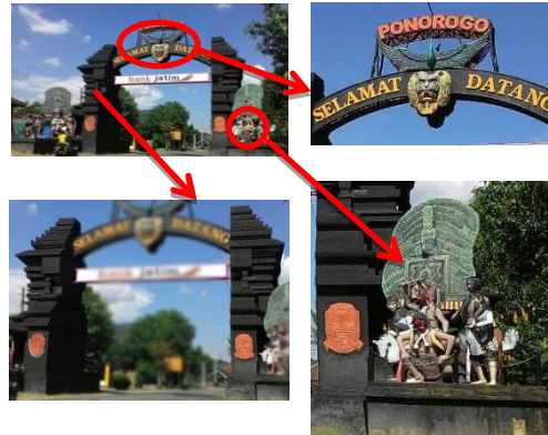
Gambar 5: Gapura pembatas kota Ponorogo dari arah Wonogiri

Citra yang dihadirkan melalui gapura ini berdasarkan persepsi masyarakat adalah kerajaan Jawa kuno, persepsi tersebut muncul dibenak masyarakat dikarenakan dua gapura yang berwarna hitam yang menyerupai bentuk candi yang terbelah. Bentuk tersebut merupakan replika dari candi bentar yang muncul saat kerajaan Majapahit. Persepsi masyarakat juga terkait dengan bentuk patung-patung Reog yang menghiasi di samping gapura tersebut, maka dari itu persepsi masyarakat menyimpulkan bahwa Ponorogo merupakan dahulunya adalah sebuah Kerajaan yang merupakan lahirnya sebuah kesenian Reog.