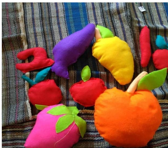
Gambar 7 : Hasil Jadi APE Pillow Doll