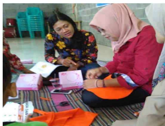
Gambar 6: Proses menjahit