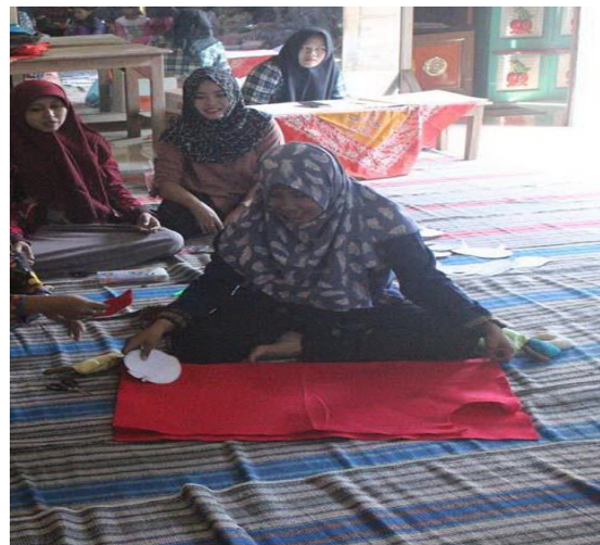
Gambar 3 : Pelatihan cara membuat pola

Selanjutnya peserta dibagi menjadi tiga kelompok kecil yang didampingi tim pengabdian sebagai tutor. Masing-masing kelompok diajari secara langsung tahap pemilihan bentuk yang diinginkan, pembuatan pola dasar dengan menggambar di kertas, menggunting bahan mengikuti pola, proses menjahit, mengisi pola dengan kain perca, proses merapikan, sehingga menjadi Pillow Doll . Tahap-tahap pelatihan pembuatan APE Pillow Doll sebagaimana pada gambar 3, 4, dan 5.