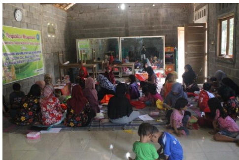
Gambar 2. Pendampingan dalam memberikan Motivasi serta Penyuluhan