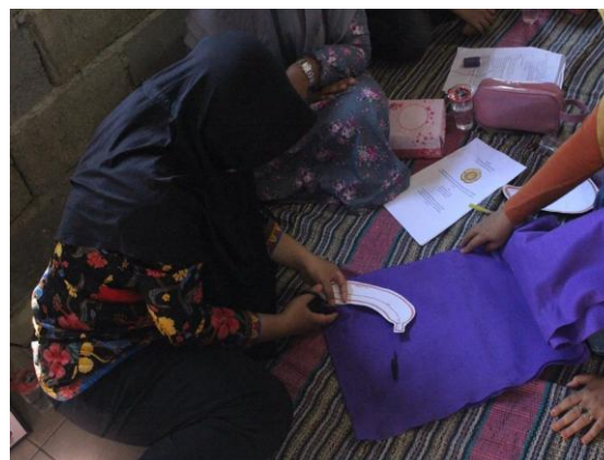
Gambar 4: Proses menggunting pola