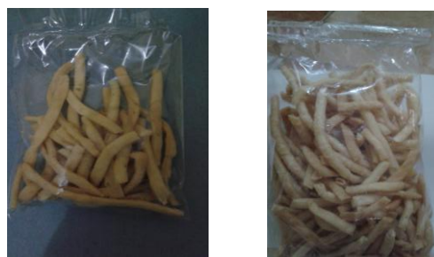
Gambar 3. Produk Stik Sehat Cumi dan Patikoli

memberikan pendampingan secara terus menerus sehingga keterampilan yang telah diperoleh dapat diimplementasikan dan dapat diketahui perkembangannya.