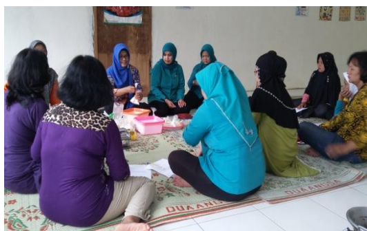
Gambar 2. Proses Pelatihan

Penyuluhan dan pelatihan dilakukan dengan metode edukasional dan menyenangkan supaya ilmu yang diberikan dapat terserap dengan baik. Harapannya dengan pengetahuan dan keterampilan yang diperoleh selama masa pelatihan, dapat merencanakan usaha sederhana khususnya di bidang industri kreatif, dan mampu mendatangkan penghasilan tambahan.