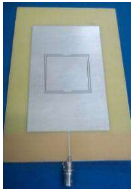
Gambar 2. Prototipe Antena Mikrostrip Double Pole-Ground Plane CSRR Tampak Depan

Berdasarkan hasil perancangan pada software CST Microwave Studio 2012 seperti terlihat pada Gambar, maka dibuat prototipe antena mikrostrip DP-GP CSRR. Dimensi prototipe antena adalah 214 mm x 134 mm.