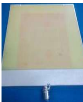
Gambar 3. Prototipe Antena Mikrostrip Double Pole-Ground Plane CSRR Tampak Belakang