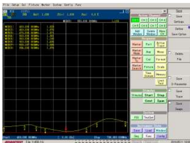
Gambar 6. Nilai VSWR Hasil Pengukuran Antena Mikrostrip DP-GP CSRR

Hasil pengukuran nilai VSWR antenna prototipe ditunjukkan pada gambar, dimana diperoleh nilai VSWR dibawah 2 pada rentang frekuensi 400 MHz – 625 MHz.