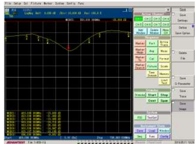
Gambar 4. Nilai Return Loss Hasil Pengukuran Prototipe Antena Mikrostrip DP-GP CSRR

berikut, dimana nilai S11 berada dibawah -10 dB pada rentang frekuensi 400 MHz – 625 MHz. Lebar bandwidth dari antena prototipe DP-GP CSRR sekitar 225 MHz.