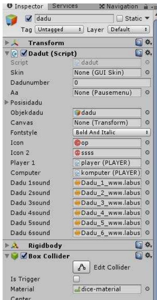
Gambar 4. Gambar Set Dadu