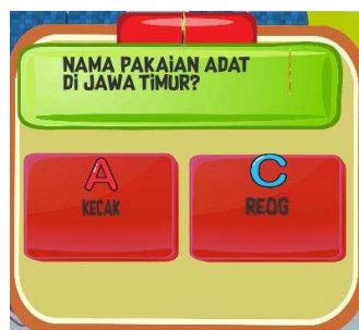
Gambar 5. Tampilan Soal