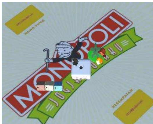
Gambar 3. Gambar Pengujian dadu

Pada pengujian metode LCG penulis melakukan pengujian pada dadu yang berisikan adat istiadat di Indonesia