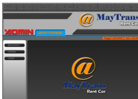
Gambar 4.1 Halaman Utama

Halaman ini merupakan tampilan awal dari Sistem Informasi sebelum login sebagai admin.