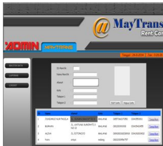
Gambar 4.5 Data Pemilik

Gambar dibawah merupakan tampilan dari menu pemilik