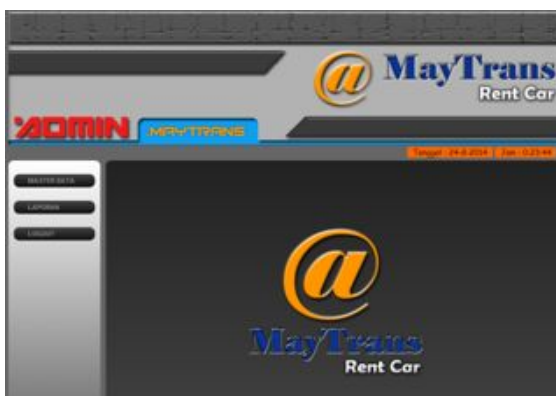
Gambar 4.3 Halaman Setelah Login

Tampilan pada gambar merupakan halaman setelah login admin