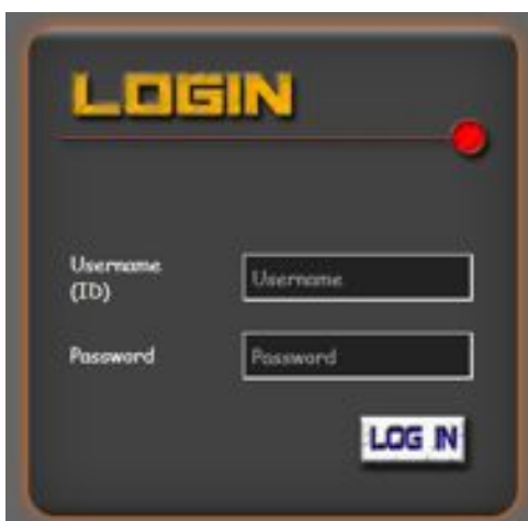
Gambar 4.2 Halaman Login Admin