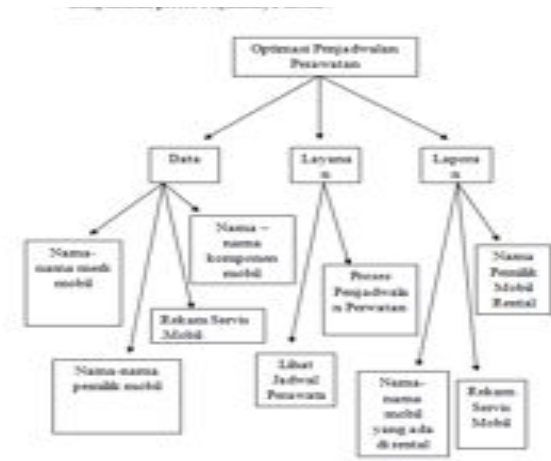
Gambar 3.2. Work breakdown System

Gambar di bawah ini adalah tentang work breakdown optimasi penjadwalan perawatan mobil yang ditunjukkan dengan gambar