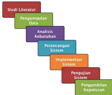
Gambar 1 Diagram Blok Penelitian