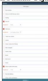
Gambar 4 Tampilan Pilihan Gejala