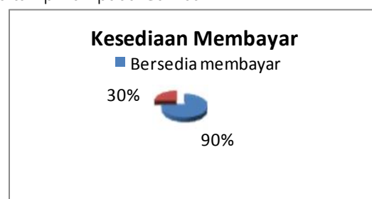
Gambar 1. Responden yang bersedia dan tidak bersedia membayar WTP

Sebanyak 120 responden dimintai pendapatnya mengenai kesediaannya untuk membayar. Sebagian besar responden, yaitu sebanyak 90 persen menyatakan bersedia untuk membayar, dan sisanya sebanyak 30 persen menyatakan tidak bersedia untuk membayar. Perbandingan persentase responden yang bersedia dan tidak bersedia membayar ditampilkan pada Gambar 1.