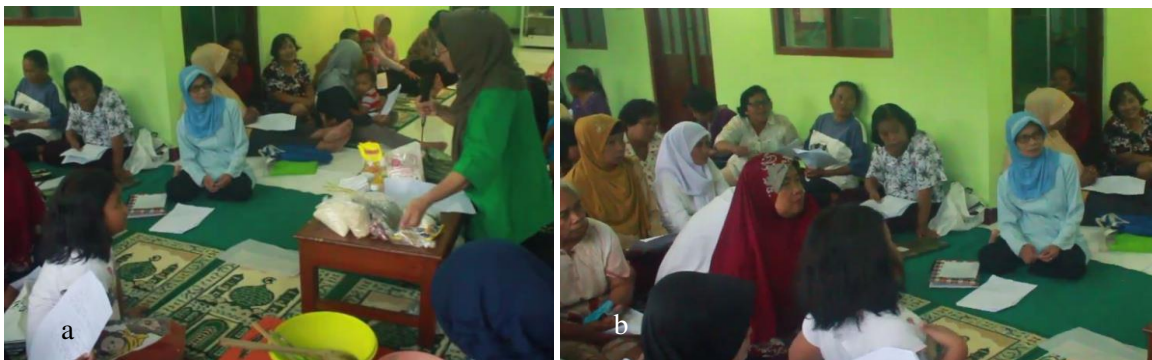
Gambar 2. Pengolahan hasil sayuran. Ket a. praktik pembuatan kripik sayur, b proses sosialisasi

Pendampingan ini bertujuan memberikan keterampilan dalam pengelolaan sayuran seperti pengolahan sayur sebagai keripik sayur, sehingga hasil panen sayur yang dihasilkan tidak hanya di makan segar atau dijadikan lalapan namun dapat ditingkatkan nilai ekonominya menjadi keripik sayur.