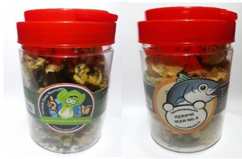
Gambar 3. Produk hasil budidaya aquavertikulture sayur dan ikan. Ket a. Kripik sawi, b. Kripik ikan