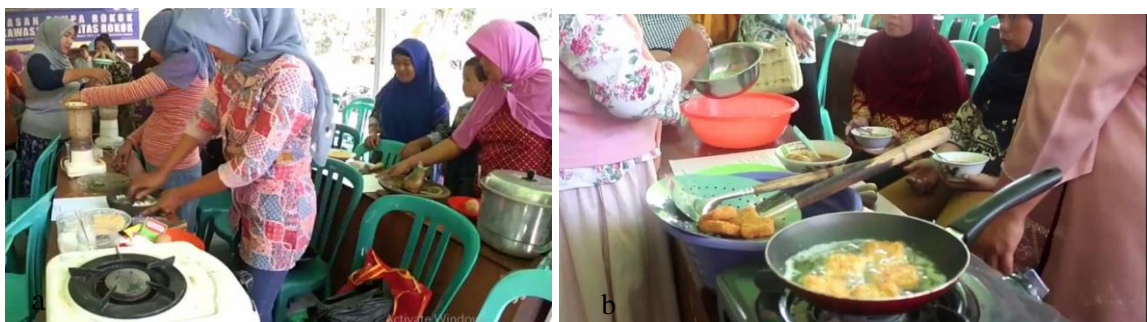
Gambar 3. Pengolahan hasil ikan. Ket a. praktik pembuatan nugget ikan, b hasil olahan nugget

ketrampilan dan upaya peningkatan nilai ekonomi ikan segar adapun keterampilan yang diberikan kepada ibu rumah tangga yaitu pembuatan nugget ikan