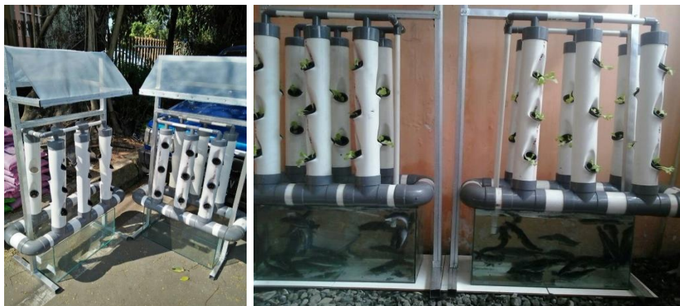
Gambar 1. Teknologi tepat guna Aquavertikulture

Teknologi yang diberikan kepada ibu rumah tangga di Kelurahan Pandanwangi yaitu berupa bantuan inovasi teknologi dari kombinasi konsep budidaya ikan dan tanaman yang diterapkan oleh ibu rumah tangga pada lahan sempit pekarangan rumah masing-masing, teknologi verticulture merupakan teknologi budidaya tanaman secara vertikal berbasis hidroponik, sehingga pengenalan teknologi kepada ibu rumah tangga tersebut diperkenalkan secara menyeluruh yaitu dimulai dengan memanfaatkan bahan sederhana seperti botol bekas sebagai sarana teknologi budidaya tanaman. Kemudian teknologi vertikulture disini dikombinasikan dengan teknologi aquakulture dengan harapan kombinasi tanaman dan ikan akan menciptakan siklus yang berkesinambungan satu sama lain.