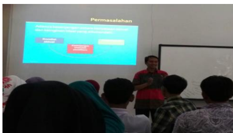
Gambar 2: Penulis memaparkan permasalahan karya ilmiah

Guru diharapkan mampu mencari informasi di buku, internet, dan seminar supaya guru memiliki inovasi mengajar (Sakti & Wijayanti, 2014). Para peserta yang mengikuti pelatihan penulisan ini adalah calon guru sekolah dasar. Oleh karena itu, para peserta diharapkan memiliki kemampuan untuk membaca, menyimak, menulis, mengolah, dan membicarakan informasi yang bersumber dari buku, internet, dan seminar.