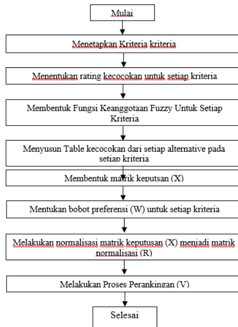
Gambar 1. Flowchart Kerangka Penelitian

Menjelaskan tentang kerangka penelitian flowchart kerangka penelitian diawali dengan tahap studi literatur. Studi literatur merupakan langkah awal dalam melakukan penelitian, berupa studi penulisan berdasarkan buku-buku perpustakaan dan sumber lainnya yang relevan dengan hal yang akan dibahas dalam penelitian.