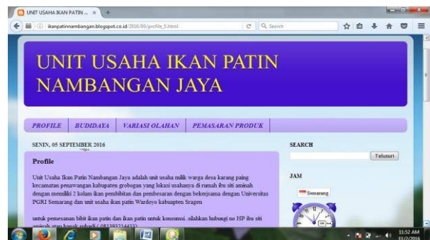
Gambar 8. Blog Pemasaran Produk Ikan Patin

menyajikan berbagai macam menu yang dapat dipesan dan menyediakan bibit dan ikan patin konsumsi untuk warga sekitar, sehingga produk blog ini sangat mudah digunakan oleh UMKM Nambangan Jaya dan Gending Jaya kedepannya.