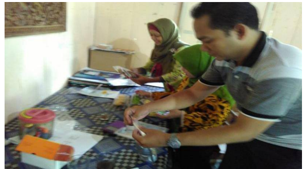
Gambar 5. Proses Pengemasan ( Packing ) Produk Variasi Olahan Ikan Patin oleh Tim

efisien bagi warga, dengan harapan produk menjadi laku terjual dengan laris.