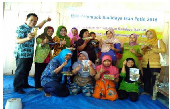
Gambar 6. Pelatihan Pengemasan ( Packing ) Produk Variasi Olahan Ikan Patin oleh Tim

Kegiatan selanjutnya adalah pemberian alat dan bahan pembuatan produk olahan ikan patin oleh tim Universitas PGRI Semarang kepada perwakilan UMKM Nambangan Jaya dan Gending Jaya di wilayah Desa Karangpaing Kecamatan Penawangan Kabupaten Grobogan, dengan harapan alat ini dapat digunakan secara baik dan efektif digunakan dalam pengolahan ikan