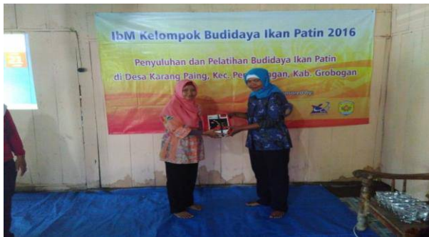
Gambar 7. Pemberian Peralatan Pembuatan Ikan Patin oleh Tim

patin seperti abon, bakso, kripiik, nugget dan lain sebagainya secara mudah dan menarik.