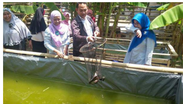
Gambar 3. Pengambilan Ikan Patin Konsumsi di Kolam

Kemudian langkah selanjutnya adalah melakukan pengambilan ikan patin produksi di Desa Karangpaing yang telah disediakan di 4 (empat) kolam yang ada meliputi 2 kolam pembibitan dan 2 kolam pembesaran ikan patin, hal ini mempermudah warga untuk melakukan pelatihan kapan saja dan dimana saja, sehingga lebih fleksibel.