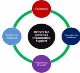
Gambar 1 Drivers for Perceived Organizational Support

kesempatan untuk berkembang oleh organisasinya.