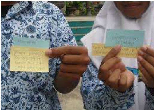
c. Siswa mendapatkan pasangannya