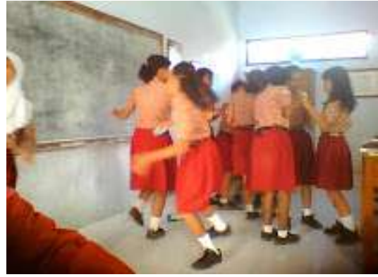
b. Siswa sedang mencari pasangannya