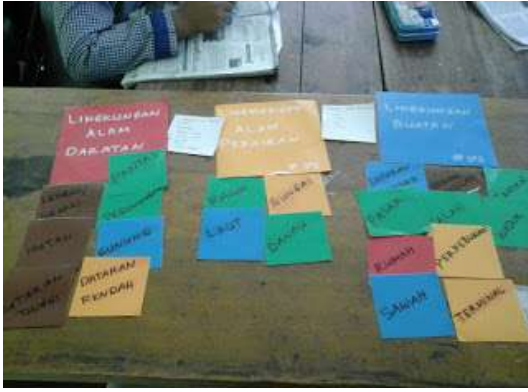
a. Contoh kartu soal dan kartu jawaban yang disiapkan oleh guru