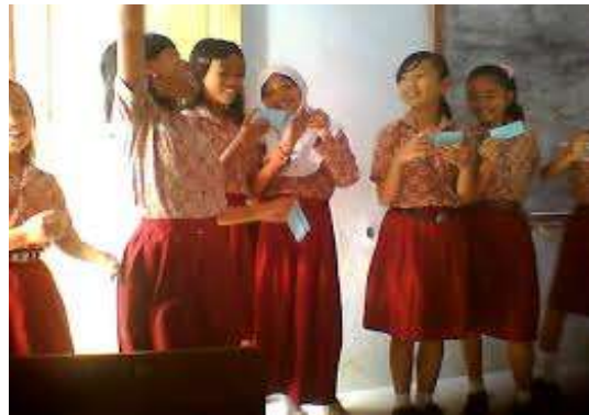
d. Siswa mempresentasikan hasil temuannya di depan kelas