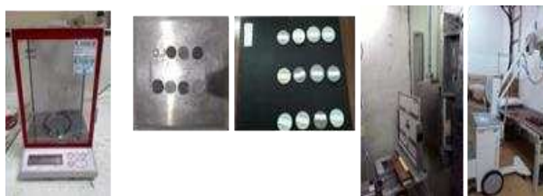
Gambar 3. Beberapa Peralatan dan Fasilitas yang Digunakan dalam Percobaan Attenuasi Perisai Radiasi.

Kemampuan menyerap sinar-x setiap sampel diuji dengan radiografi sinar-x pada berbagai ketebalan. Film yang menangkap gambar hasil pengujian diproses di kamar gelap. Pengukuran intensitas awal dan akhir yang ditunjukkan pada film tersebut dihitung menggunakan densitometer. Gambar 3 menunjukkan peralatan yang digunakan dalam percobaan perhitungan atenuasi perisai radiasi yang dilakukan. Hasil pengukuran intensitas ini lalu dibandingkan dengan hasil simulasi.